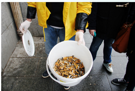
Collecte de mégots (8,7 kg) à Rennes